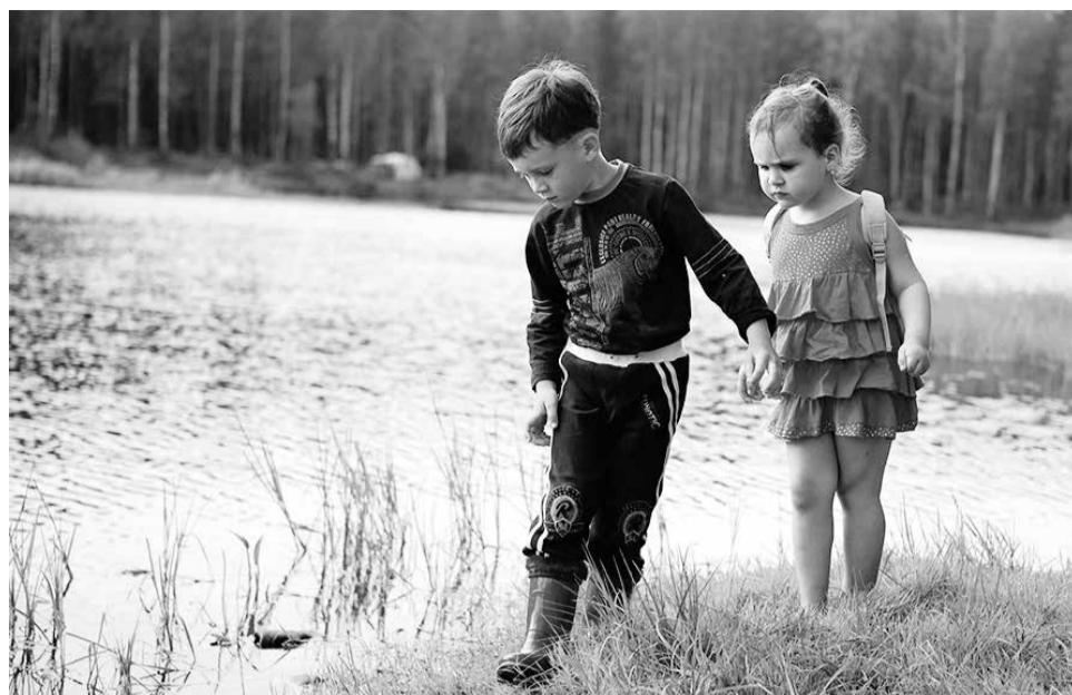
Встретить клещей можно в парковых зонах и на городских газонах весной и в начале лета. С июля их активность снижается, но в теплых регионах может продолжаться до октября.

В случае клещевого энцефалита специфического лечения не существует. При возникновении симптомов, свидетельствующих о поражении центральной нервной системы (менингит, энцефалит) больного следует незамедлительно госпитализировать для оказания поддерживающей терапии. В качестве симптоматического лечения часто прибегают к кортикостероидным средствам. В тяжелых случаях возникает необходимость в интубации трахеи с последующим проведением искусственной вентиляции легких.